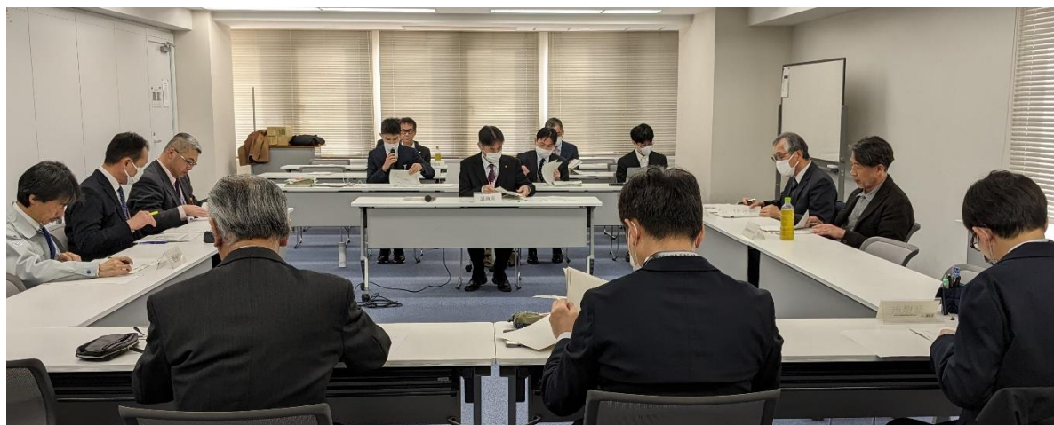
【滋賀県浄化槽適正処理促進協議会】