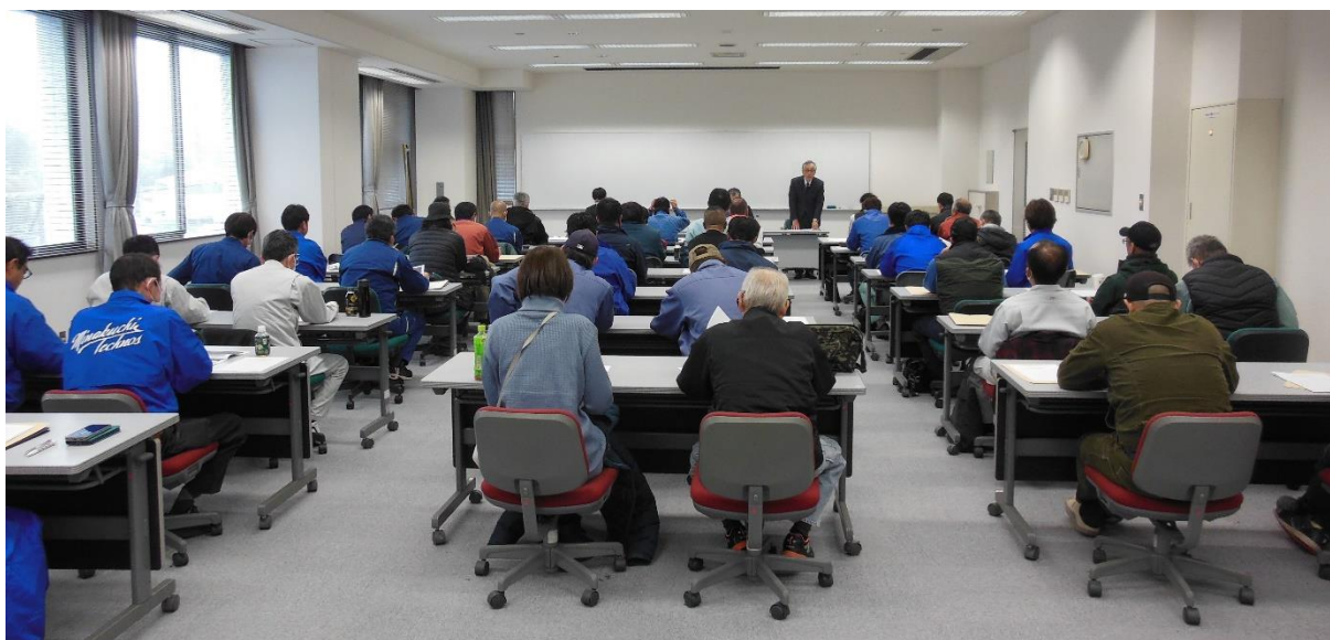
【3 月 5 日の講習会】