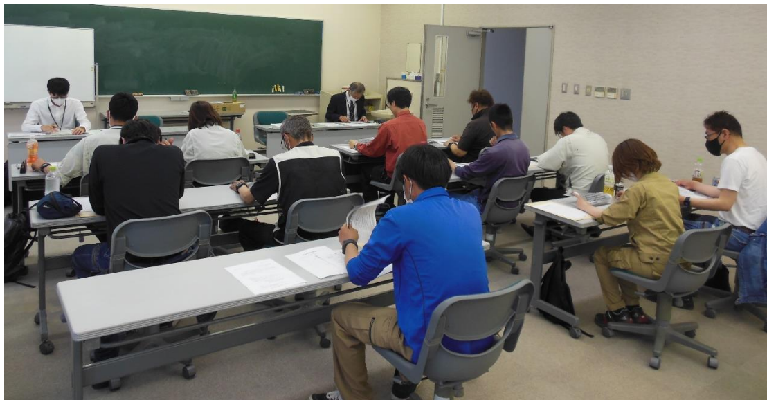
【5 月 17 日の講習会】

効率化 11 条検査の一次検査業務を行う指定採水員の指定を受けるための要件である指定講習会を令和 5 年 5 月 16 日（火）、17 日（水）の両日、及び令和 6 年 3 月 4 日（月）、5 日（火）の両日に開催した。何れの講習会も有効期限満了に伴う更新講習会として開催したが、新たに採水員の指定を受けようとする方も同時に受講した。5 月は合わせて 23 名、3 月は合わせて 67 名の受講があった。