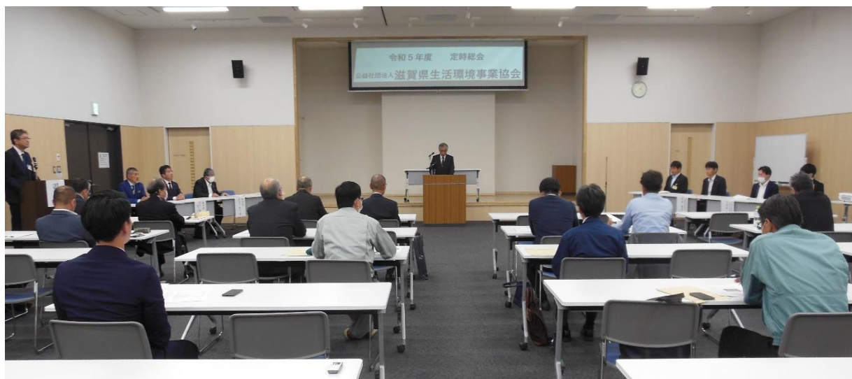
【当協会の令和5年度定時総会の様子】