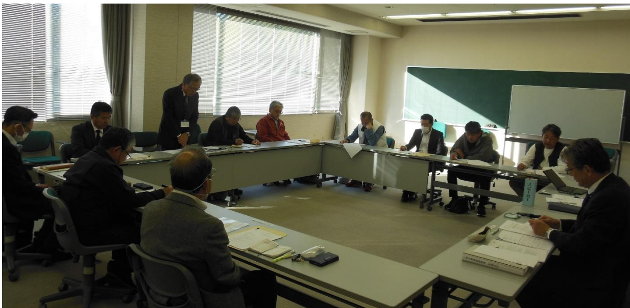
【第 4 2 回理事会の様子】