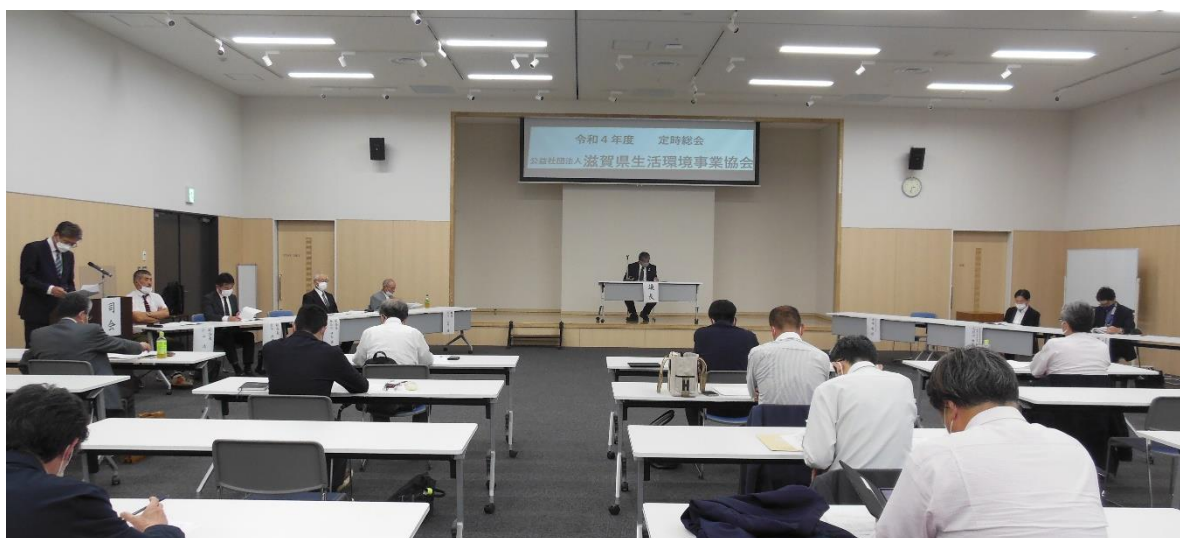
【当協会の令和4年度定時総会の様子】