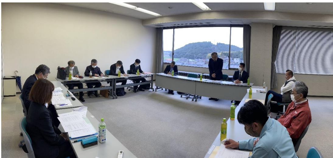
【第 39 回理事会の様子】