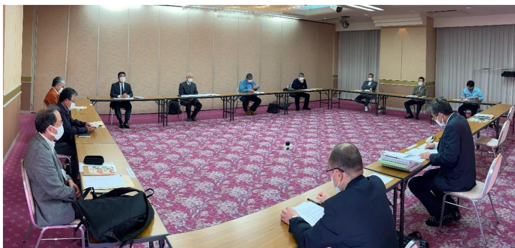
【第 34 回理事会の様子】