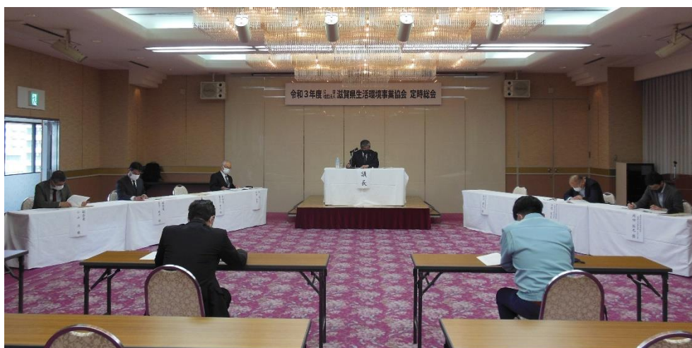
【当協会の令和3年度定時総会の様子】