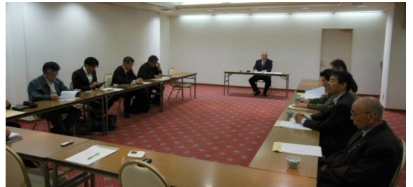
第 19 回理事会の様子