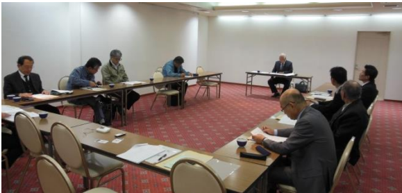
第 18 回理事会の様子